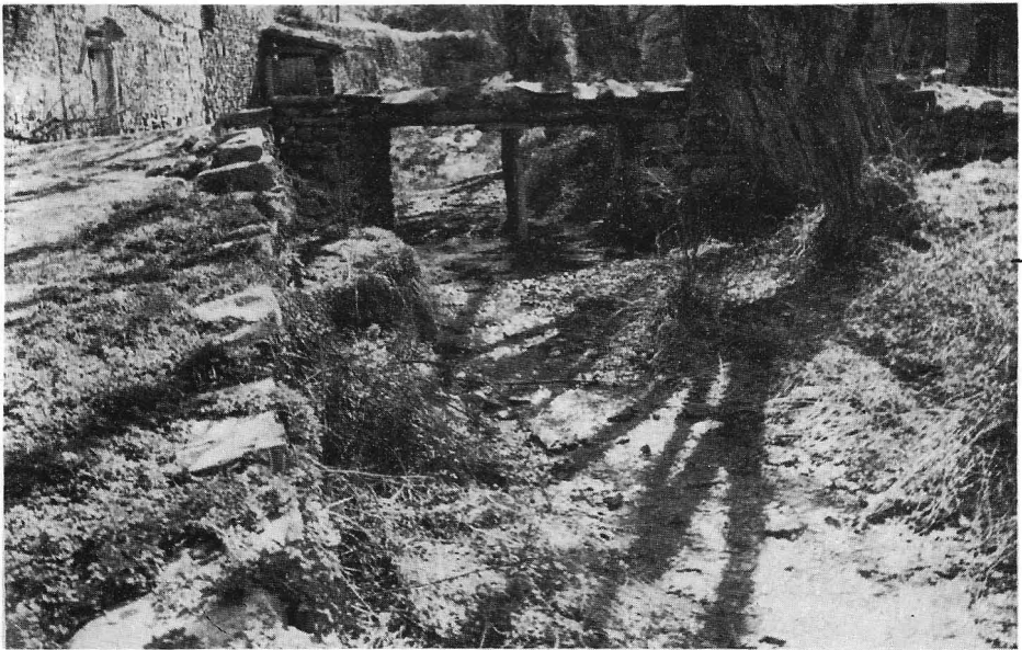
Arroyo que cruza por el centro del Villar de Enciso.