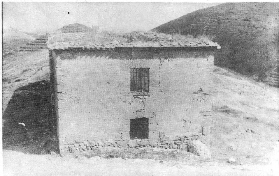
Ermita de las Once Mil Vírgenes, en el pueblo de Turruncùn, cuya techumbre se derrumbó en el terremoto del año 1929.